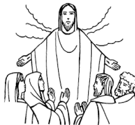
Il Signore Gesù, dopo aver parlato con loro, fu elevato in cielo e sedette alla destra di Dio.